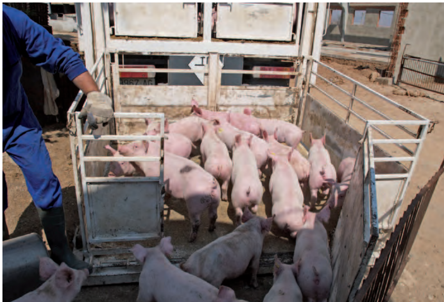
Es importante controlar el movimiento de animales y establecer prácticas de bioseguridad.

les sin signos clínicos. El perfil de las cepas en muchas granjas era dinámico, donde se detectaron cepas porcinas preexistentes “residentes”, cepas nuevas, así como cepas con nuevos genomas reordenados no identificados previamente. Además, la introducción en 2009 del virus pandémico H1N1 en las poblaciones de cerdos alteró la dinámica de los virus endémicos y resultó, una vez más, en la aparición de nuevas reorganizaciones de consecuencias desconocidas para los cerdos y las personas. Por lo tanto, los rebaños endémicamente infectados representan un reservorio de virus que pueden infectar a otros cerdos, a otras especies animales y, sobre todo, a los seres humanos. Las infecciones con virus de la influenza A también pueden ser frecuentes en reproductoras. Se han detectado múltiples subtipos y cepas coexistiendo en cinco explotaciones de cría monitorizadas durante un periodo de un año (Díaz et al. , 2014).